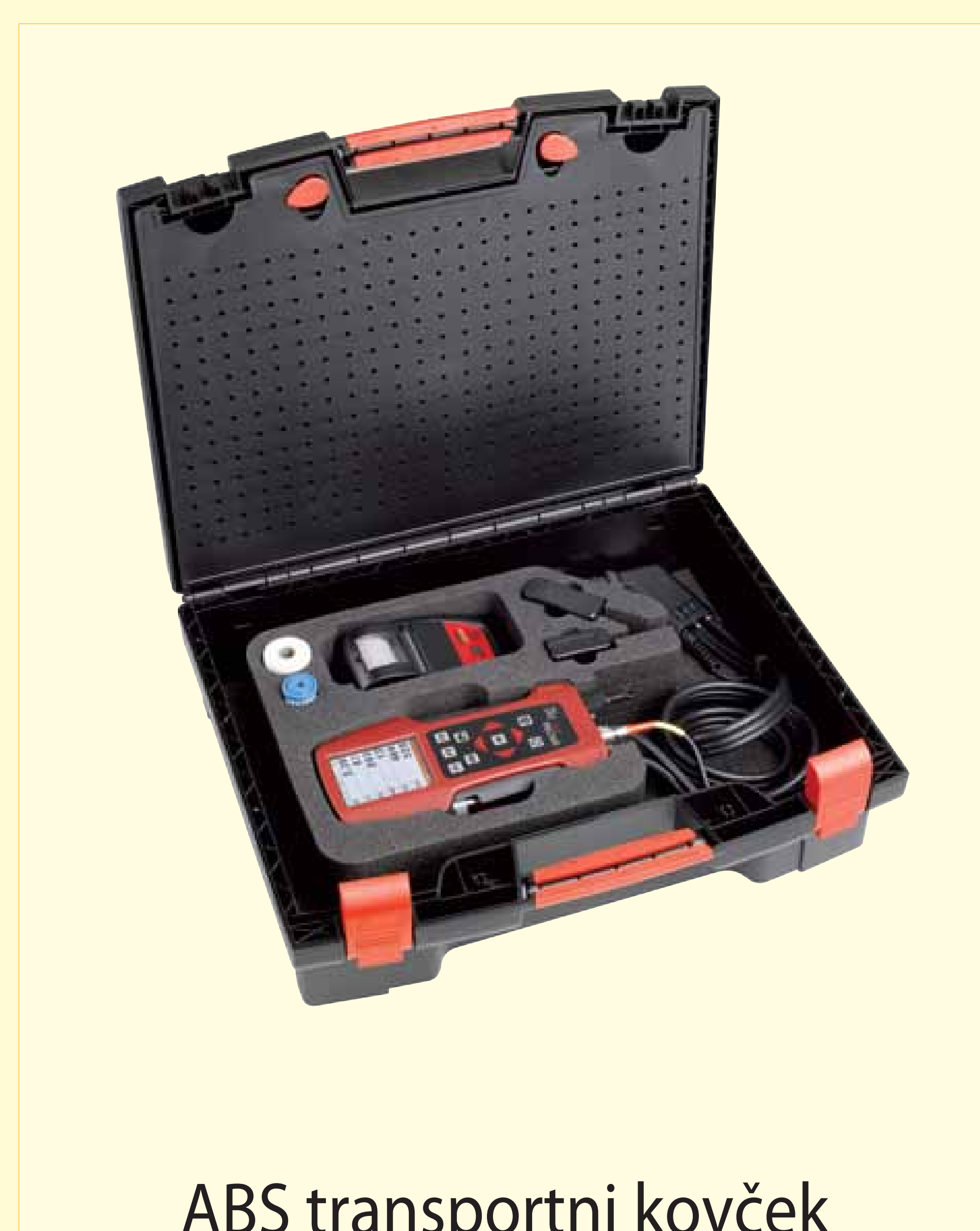
ABS transportni kovček